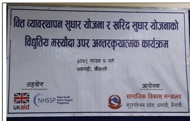
अन्तरक्रियात्मक कार्यक्रमको व्यानर