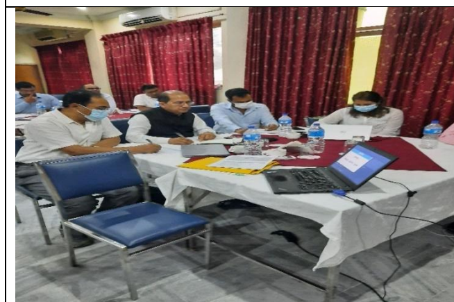
प्राविधिक परामर्शदाता NHSSP को टिम अन्तरक्रियात्मक कार्यक्रममा सहभागिता जनाउँदै