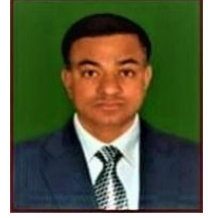
सामाजिक विकास मन्त्रालय